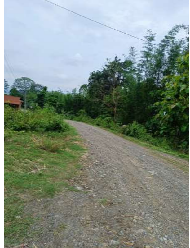
मिक्लाजुड गाउँपालिका वडा नं. २ को कार्यालय भवन तथा निर्माणा सम्पन्न सडकहरु;